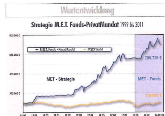
Die Strategie des M.E.T. Fonds-PrivatMandat konnte den MSCI World in den vergangenen 10 Jahren deutlich outperformen.

jedes denkbare Zielinvestment zu einer roten, gelben oder grünen Ampel. Springt die Ampel auf Grün, so wird aus dem Fundus bereits analysierter Zielfonds geschöpft.